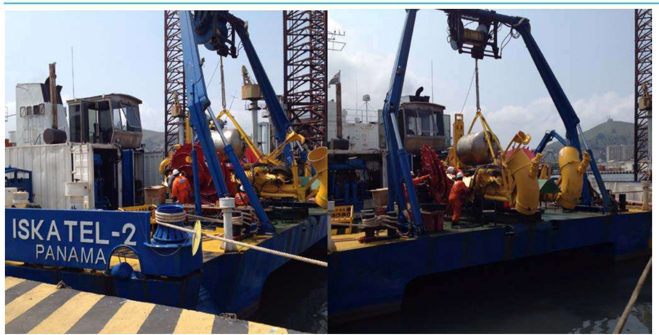
LEO PTM onboard of DP-2 Iskatel-2